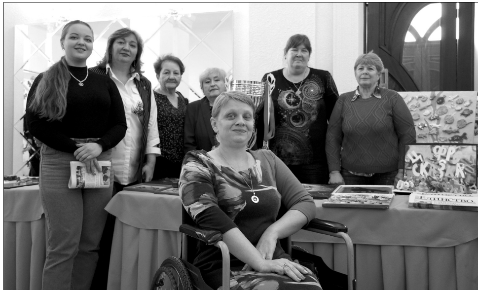
■ Часть активной творческой команды ОРО ВОИ (фото сверху). Награждение ОРО ВОИ за первое место в конкурсе (фото снизу).

тябрьской (с) районной организации Ростовской областной организации Всероссийского общества инвалидов.